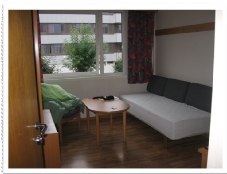
A kollégiumi szoba.

Voldát azoknak az embereknek ajánlom, akik nincsenek hozzászokva a nagyváros gyorsaságához, vagy azoknak, akik épp ezt szeretnék hátrahagyni ezt egy kis időre. Volda egy nagyon kicsi város, itthoni viszonylatokban nézve, de ami előnye, hogy minden közel van egymáshoz. A központban rengeteg bolt közül választhatunk, négy hónap alatt pedig az ember kitapasztalja, hogy melyikben mi is olcsó. Erasmusos diákként minden nagyon drága, akár háromszoros árákkal is találkozunk. A hús az édesség és az alkohol az, ami borzasztóan drága, így sokszor le kellett mondani efféle „luxusokról”. Az Erasmusos diákokat mindig a kollégiumban helyezik el, ami viszont rendkívül jó színvonalú.