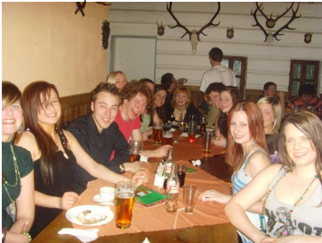
Megbeszéltük, hogy a Sziget Fesztiválon újra találkozunk augusztusban!