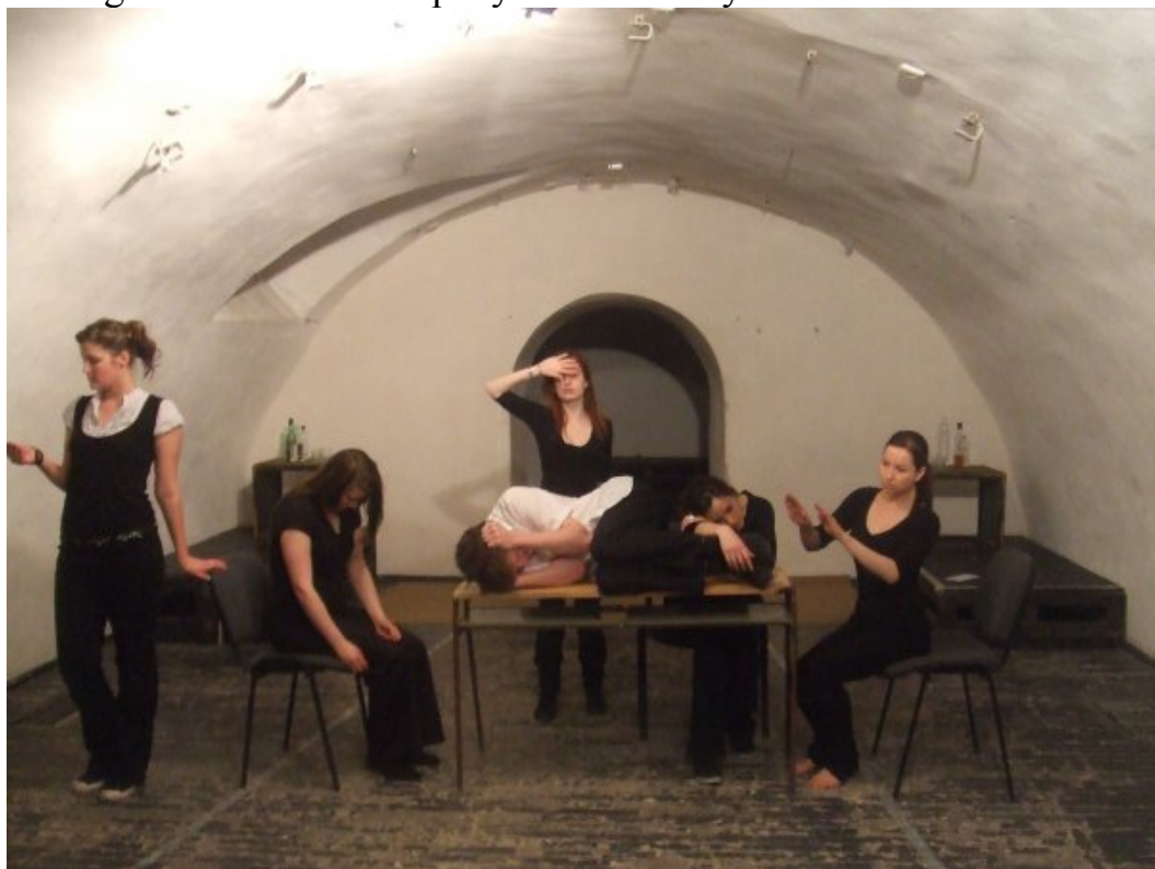
Az angol színészek és a spanyol színészlány– Csehov:Platonov